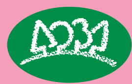
区のシンボルマーク